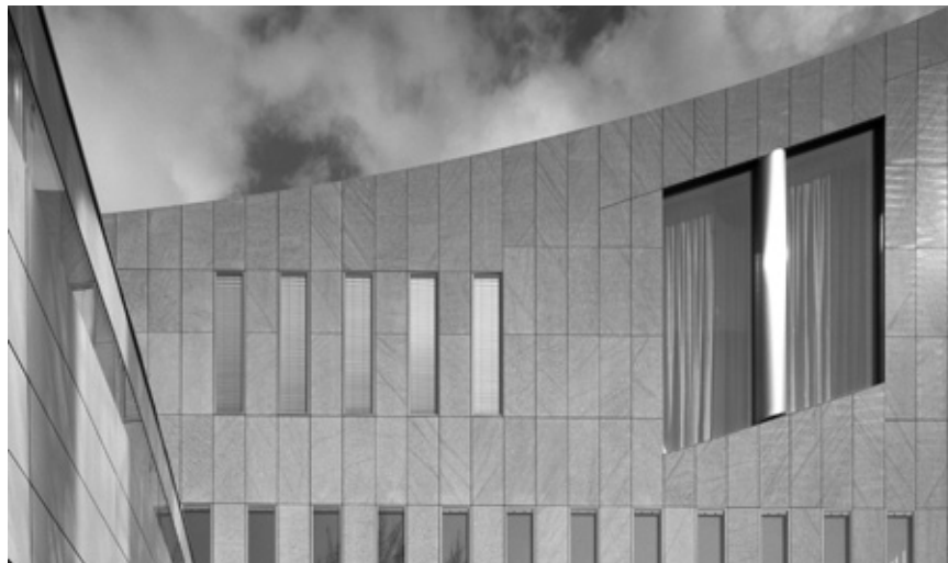
Centrum Bank, Vaduz, Fassade in Andeer, poliert.