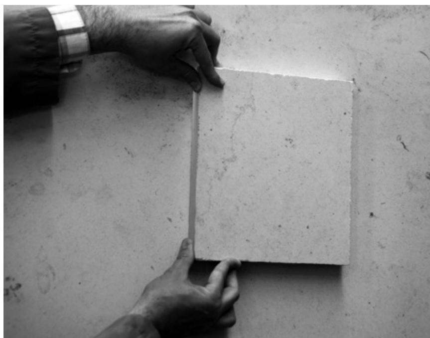
Vergleich Kalksteinmuster mit Unmassplatte.

Grundlage der unternehmerseitigen Planung ist die zur Ausführung freigegebene Planung des Architekten. Hierauf kann der Unternehmer seine Planung aufbauen. Grundsätzlich benötigt der Unternehmer eine gestalterische Freigabe und die Prüfung der Koten, Höhen und Hauptmasse wie Gebäudeecken und Lage der Fenster und angrenzenden Bauteile, die die Fassade betreffen.