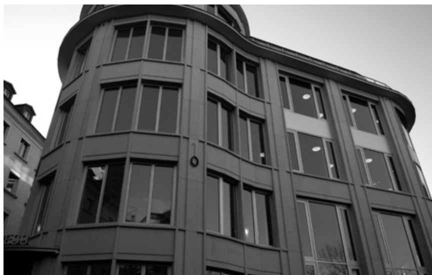
Einstein Congress, St. Gallen, Fassade in Pearl White, sandgestrahlt und gebürstet.